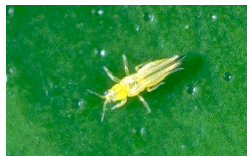
Fig 1. Frankliniella occidentalis , también denominada trip occidental de las flores, es una plaga de insecto muy importante en agricultura, dado que se alimenta una amplia variedad de especies de plantas distintas, incluyendo gran número de cultivos frutales, vegetales y ornamentales. Este insecto estropea los cultivos de muchas formas, siendo la peor causa su ovoposición en el tejido de la planta. También daña las plantas alimentándose de ellas y moteándolas de puntos plateados y agujeros por efecto de su saliva. Las ninfas de Frankliniella occidentalis se alimentan de los frutos de la planta cuando empiezan a formarse. El trip occidental de las flores es también el mayor vector del virus del bronceado del tomate, una de las enfermedades de este tipo de cultivo que mayores pérdidas económicas genera en todo el mundo.

NK = Test de Newman-Keuls ( \alpha = 5\% )