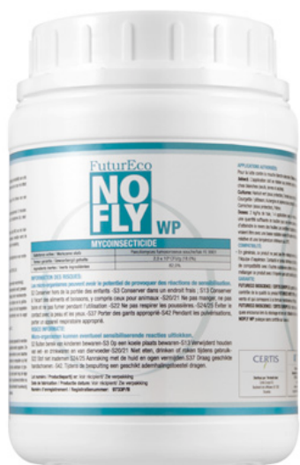
Fig 2. Producto comercial NOFLY WP