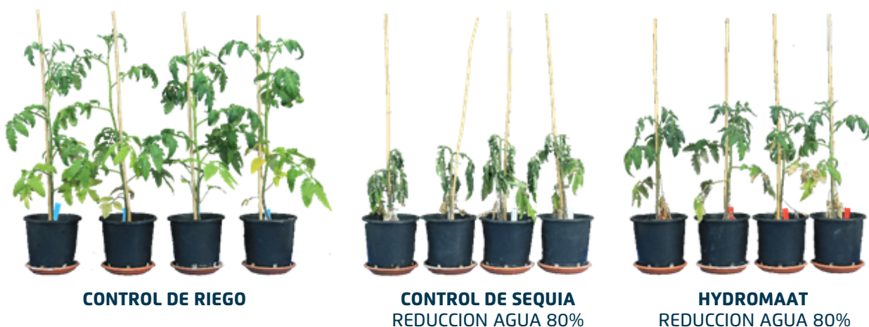
Figura. 1 Plantas de tomate al final del estudio (24 días de estrés por sequía)

El estrés por sequía afectó claramente al crecimiento y al aspecto de las plantas de control, mientras que las plantas tratadas con HydroMaat parecían más resistentes a la sequía y con una mejor fisiología (Figura 1).