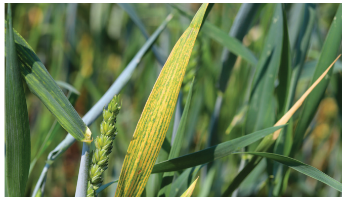
Síntoma de deficiencia de Mg en trigo