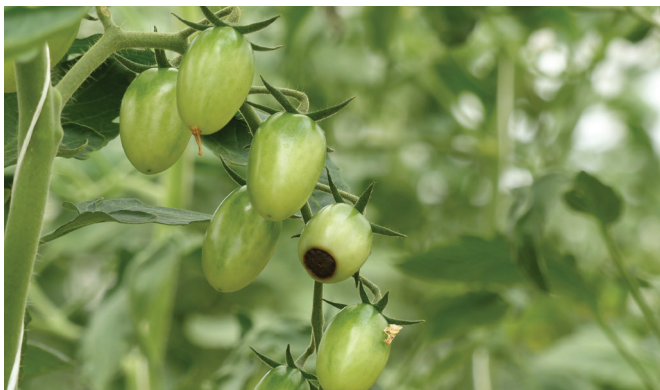
Síntoma de deficiencia de Ca en tomate