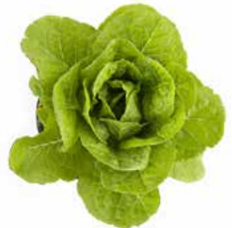
Lechuga sin deficiencia de potasio