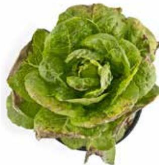
Lechuga con deficiencia de potasio