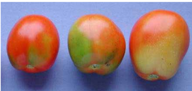
Tomates afectados por deficiencia de potasio